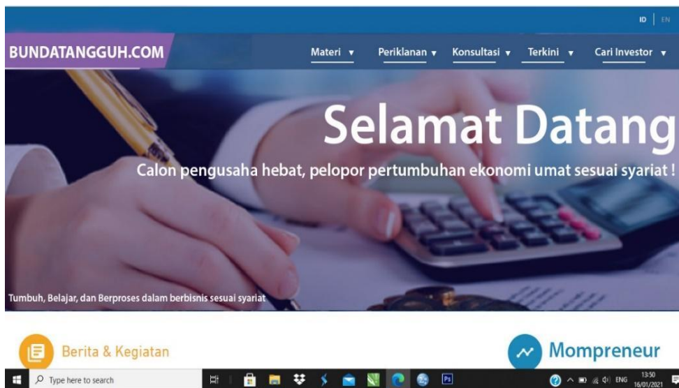
Gambar 2. Konsep program usulan Bundatangguh.com

Materi merupakan layanan utama yang diberikan oleh program usulan Bundatangguh.com dalam mendukung penggunaannya. Tentunya dalam fitur ini