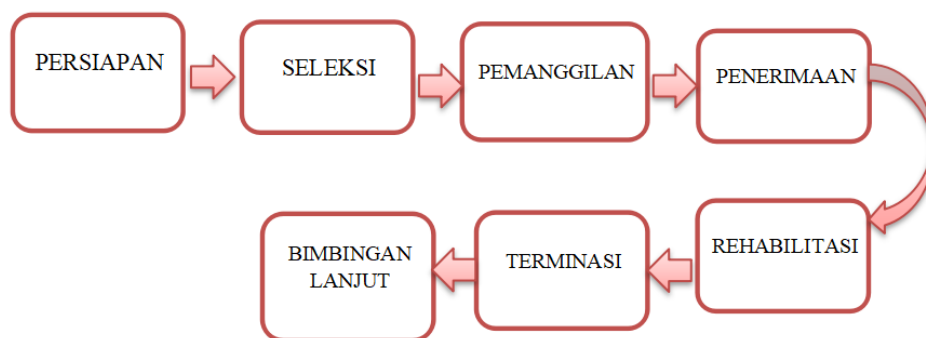
Bagan 1 Alur Pelayanan