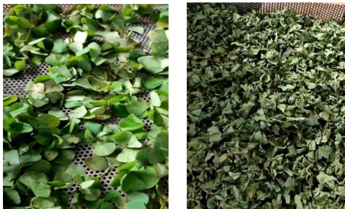
Gambar 4. Hasil daun semanggi sebelum dan sesudah dikeringkan

Penggunaan mesin pengering daun semanggi berbasis energi listrik panel surya sangat membantu proses pengeringan daun semanggi menjadi lebih mudah terutama pada saat musim penghujan yang biasanya dijemur di terik matahari maka daun dapat dikeringkan menggunakan mesin pengering daun semanggi. Higienitas pengeringan daun semanggi dengan mesin pengering dapat dijaga. Jika pengeringan daun semanggi dilakukan dengan menjemur langsung di terik matahari di bahu jalan kampung, maka higienitas tidak bisa dijaga.