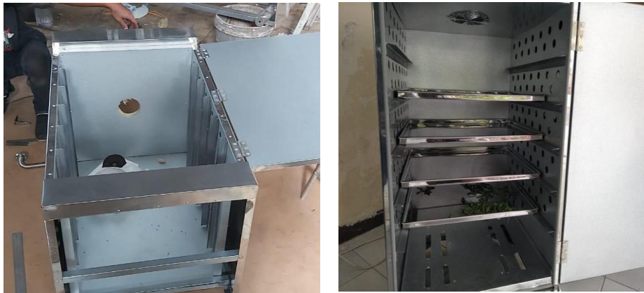
Gambar 2. Proses pembuatan mesin pengering