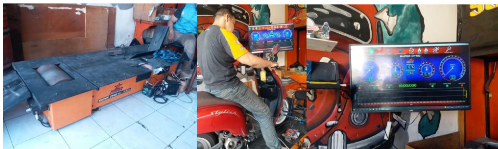
Gambar 4 Proses uji performa mesin menggunakan butanol.

Kinerja dan efisiensi mesin pembakaran internal dapat ditingkatkan dengan meningkatkan rasio kompresi dan tekanan masuk. Namun peningkatan kedua rasio tersebut dibatasi oleh fenomena knock. Selain itu, untuk meningkatkan penghematan bahan bakar dan kepadatan daya mesin bensin, perampingan sering kali dipilih sebagai pendekatan yang efisien untuk mencapai kedua tujuan tersebut. Namun hal tersebut akan meningkatkan suhu dan tekanan di dalam silinder sehingga