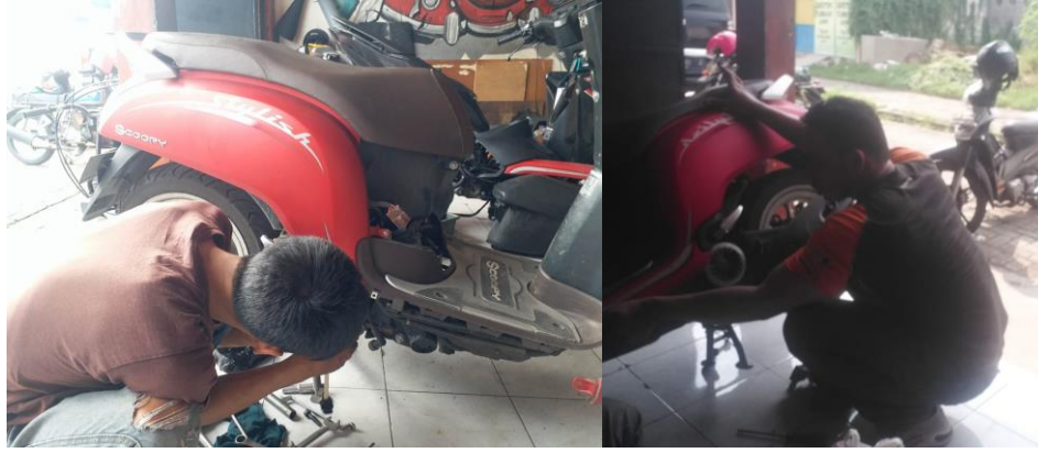
Gambar 2 Persiapan kendaraan bermotor dengan tipe CVT

Pengembangan sistem pengendalian mesin pembakaran dalam saat ini berorientasi pada emisi gas buang, kinerja dan efisiensi bahan bakar. Hal ini disebabkan oleh kenaikan harga bahan bakar yang menyebabkan krisis pada sektor transportasi; oleh karena itu sangat penting untuk mengembangkan teknologi kendaraan hemat bahan bakar [16]. Efisiensi bahan bakar mesin bensin dapat ditingkatkan dengan beberapa cara seperti dengan mengendalikan rasio udara terhadap bahan bakar (AFR). Teknologi AFR saat ini masih mempunyai banyak kendala karena sulitnya mengatur karakteristik karena pengendalian AFR biasanya hanya berupa pengendalian mesin secara internal sesuai yang ditunjukkan gambar 3. Efisiensi bahan bakar dapat ditingkatkan dengan pengaruh sistem mesin eksternal. Sistem kendali rem merupakan sistem mesin eksternal yang digunakan dalam penelitian ini.