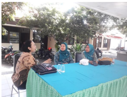
Gambar 2. Wawancara dan Penemuan Kendala