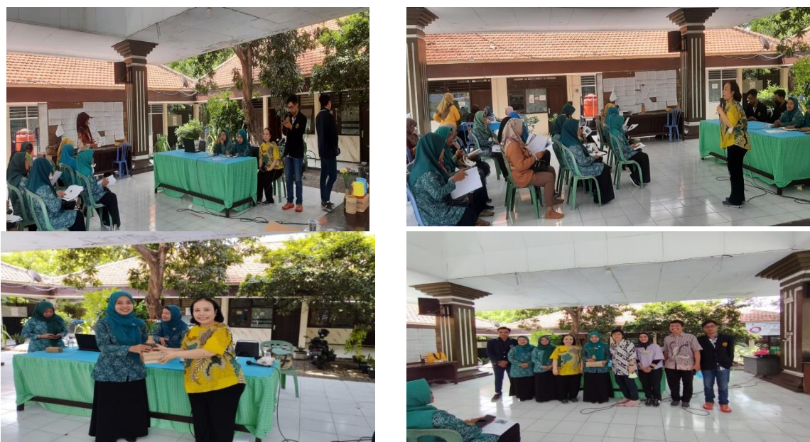
Gambar 3. Pelaksanaan Kegiatan Pengabdian Masyarakat

Namun meski hanya dilakukan oleh segelintir orang dan terkadang hanya diterapkan pada barang-barang pribadi yang dimilikinya, namun munculah konsep kesadaran warga terhadap manfaat gerakan zerowaste bagi barang – barang yang sudah tidak terpakai lagi dan ikut berpartisipasi dalam menerapkan gerakan zerowaste (refuse, reduce, reuse, recycle, rot). Berdasarkan hasil rekap kuesioner, hampir 100% warga kelurahan klampis belum pernah mendengar dan mengetahui konsep zerowaste. Temuan kuesioner juga menunjukkan bahwa kata “zerowaste” merupakan konsep baru, sehingga orang yang mengikuti konseling ini tertarik dengan subjek tersebut. Dan dari hasil kuisisioner berikutnya, warga kelurahan klampis akan menerapkan gerakan zerowaste ke anggota keluarga dengan harapan dapat mengurangi jumlah sampah yang akan berdampak pada lingkungan yang ramah, bersih dan sehat