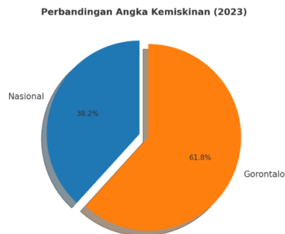
Gambar 1. Perbandingan Angka Kemiskinan Nasional dan Gorontalo Tahun 2023

memperlihatkan perbandingan angka kemiskinan Gorontalo dengan rata-rata nasional.